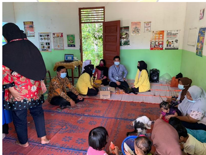
Gambar 2 | Kegiatan Sesi Diskusi dan Tanya Jawab

Setelah pemberian materi yang disampaikan oleh narasumber, kegiatan pun dilanjutkan ke sesi diskusi tanya jawab. Adapun kegiatan ini meliputi perangkuman materi oleh pembawa acara, pengajuan pertanyaan untuk evaluasi, pemberian feedback dan pemberian salam. Evaluasi dilaksanakan secara langsung dengan bertanya kepada peserta mengenai materi yang telah diberikan dan peserta menjawab sesuai dengan pemahaman yang telah didapatkan, sehingga didapatkan bahwa kegiatan pengenalan ini berhasil dilaksanakan. Kegiatan pengabdian masyarakat diakhiri dengan pembuatan laporan kegiatan oleh pelaksana dengan melibatkan mahasiswa.