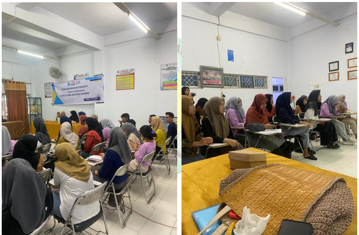
Gambar 3. Pelaksanaan Kegiatan Penyuluhan Deteksi Dini Kanker Payudara

Adapun dokumentasi pelaksanaan kegiatan penyuluhan Pencegahan Kanker Payudara secara Dini dengan SADARI dan SADARNIS sebagai berikut: