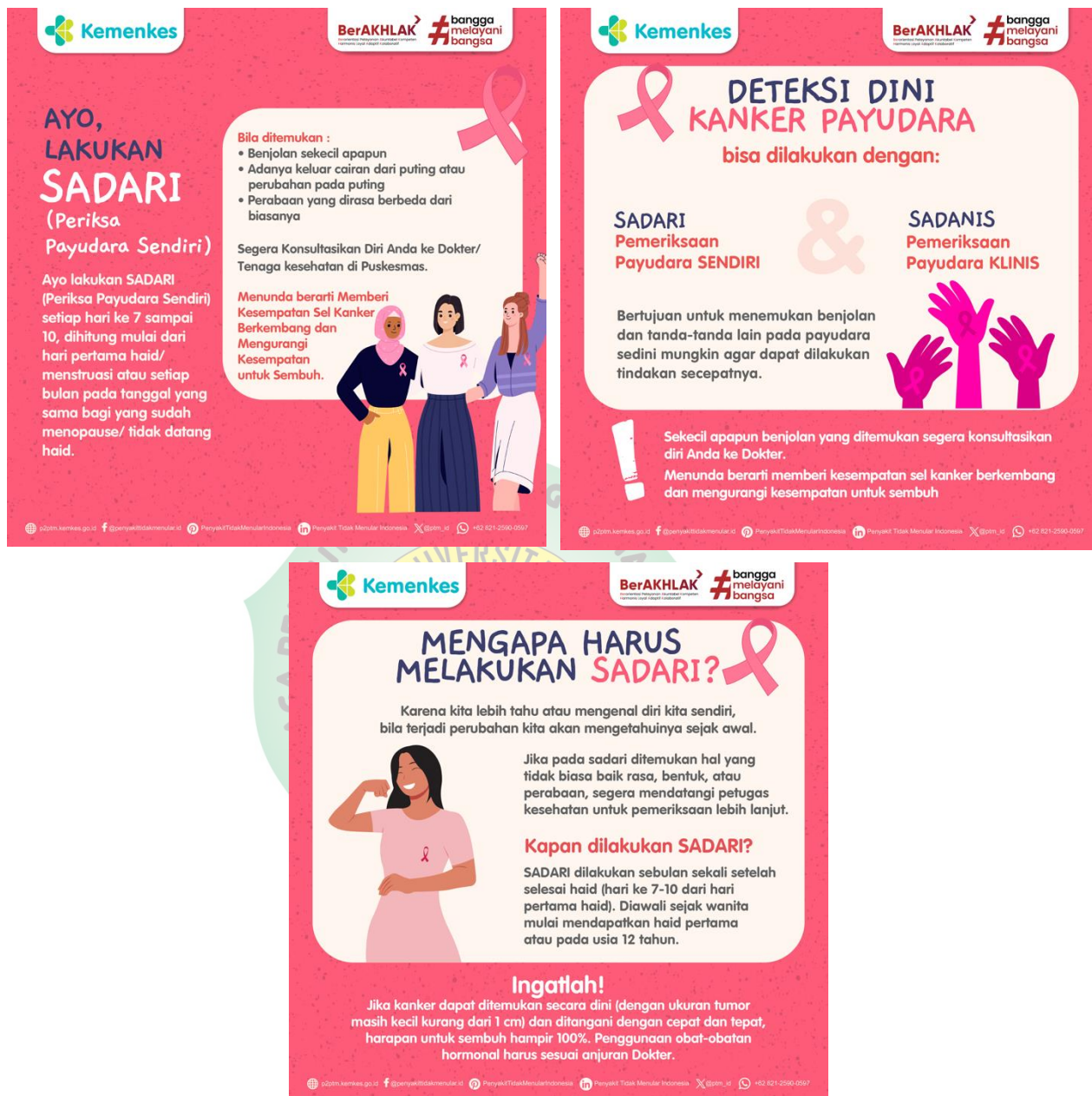
Gambar 2. Poster Penyuluhan Deteksi Dini Kanker Payudara