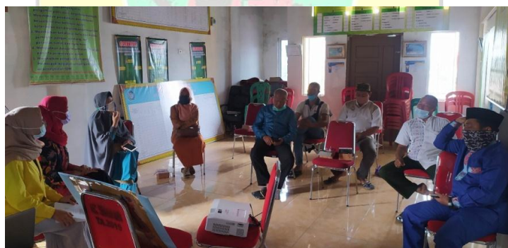
Gambar 4 | Kegiatan Penyuluhan