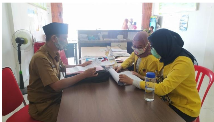
Gambar 1 | Perizinan ke pihak Pemerintah setempat

Kegiatan pengabdian masyarakat ini diawali dengan melakukan persiapan dan mengurus perizinan kepada pemerintahan setempat untuk melaksanakan pengabdian masyarakat. Kemudian selanjutnya Pelaksana Pengabdian Masyarakat bersama panitia dari mahasiswa menyusun rancangan kegiatan yang akan dilaksanakan.